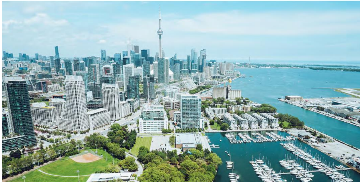
Vista aérea de Toronto, Ontario, Canadá.