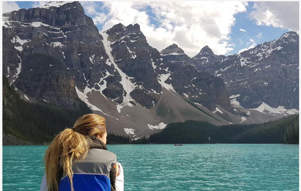
Moraine Lake, Alberta, Canadá.