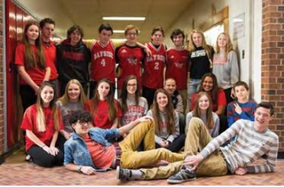
Estudiantes de "Bayside Secondary School".