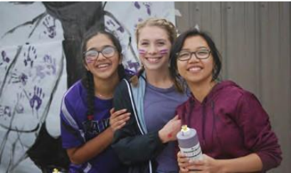
Estudiantes de "Eastside Secondary School".