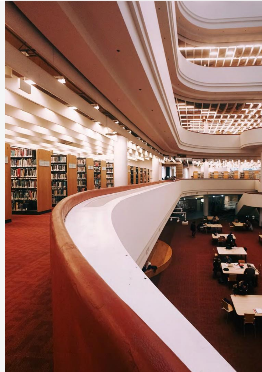
Biblioteca pública en Yonge Street, Toronto, Ontario, Canadá.