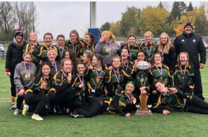
Equipo femenino de rugby de "Centennial School".