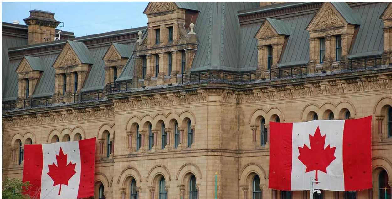
Antiguo Ayuntamiento de Toronto, Ontario, Canadá.