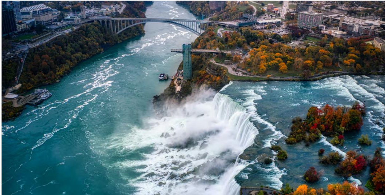
Rainbow International Bridge & Niagara Falls, frontera entre Canadá (Ontario) y Estados Unidos (Nueva York).