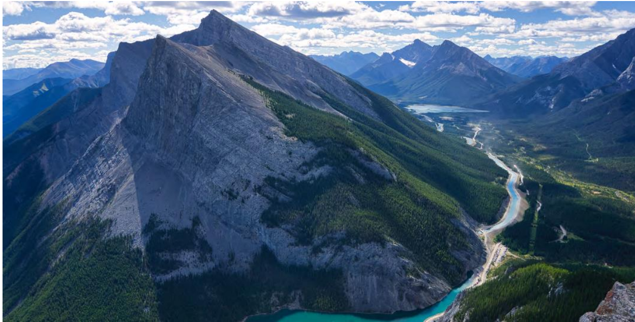
Canmore, Alberta, Canadá.